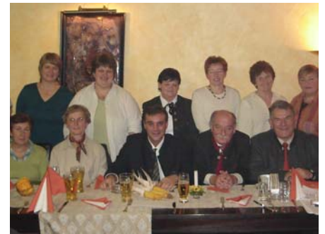
Vorstand und Ehrengäste