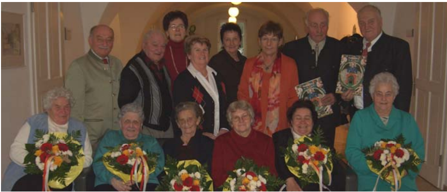
Allgemeine Gratulation am 29. November 2007 im Rathaus.