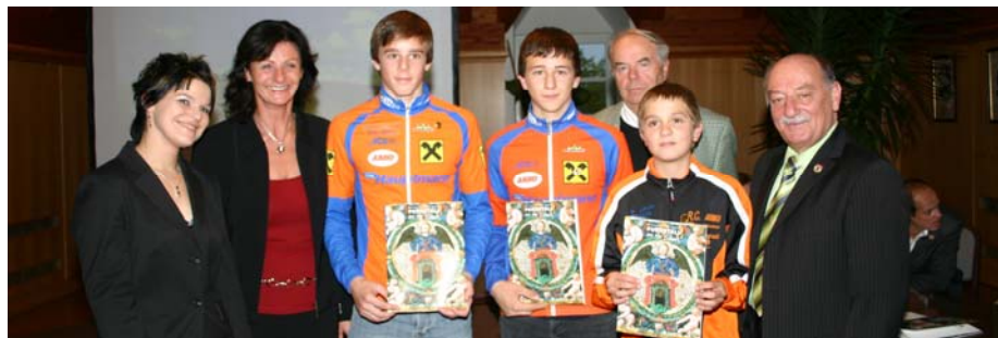
Die Radsportler des RC Purgstall Ford Hauptmann-Raiffeisen