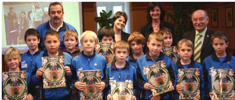
SVg Volksbank Purgstall – Jugendhauptgruppe West U9