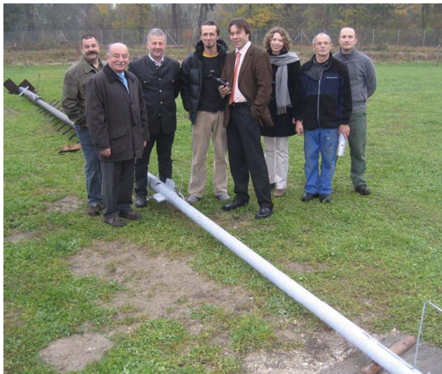
Die Projektgruppe Wind- & Wasserkraft konnte im Oktober eine Windmessanlage am Gelände der Kläranlage Purgstall verwirklichen. Ein von den Gemeindearbeitern gefertigter 18 m hoher Mast trägt das Messgerät (von der Fachhochschule zur Verfügung gestellt), welches alle 10 Sekunden Daten aufzeichnet.

● Selbstbaugruppen - Sind Sie interessiert an einer Selbstbaugruppe für Kleinwindkraft-, Solar-, oder Fotovoltaikanlagen teilzunehmen oder interessieren Sie sich für Elektrofahrzeuge oder generell Energiefragen in Ihrer Gemeinde?