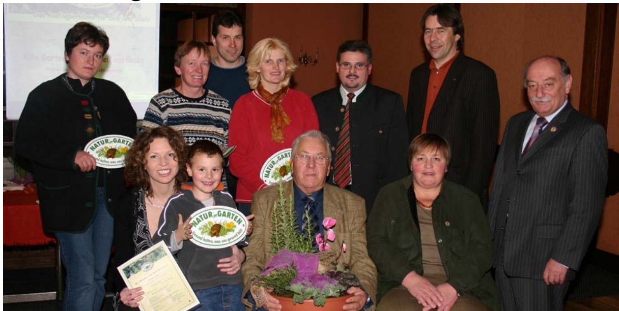
Naturgärten sowie die schönsten Bauerngärten wurden am 20.11.2007 von der Marktgemeinde und der Umweltberatung ausgezeichnet. S. 7

● Aktuelles aus dem Standesamt ab Seite 4 ● Jagdpatchauszahlung Seite 2