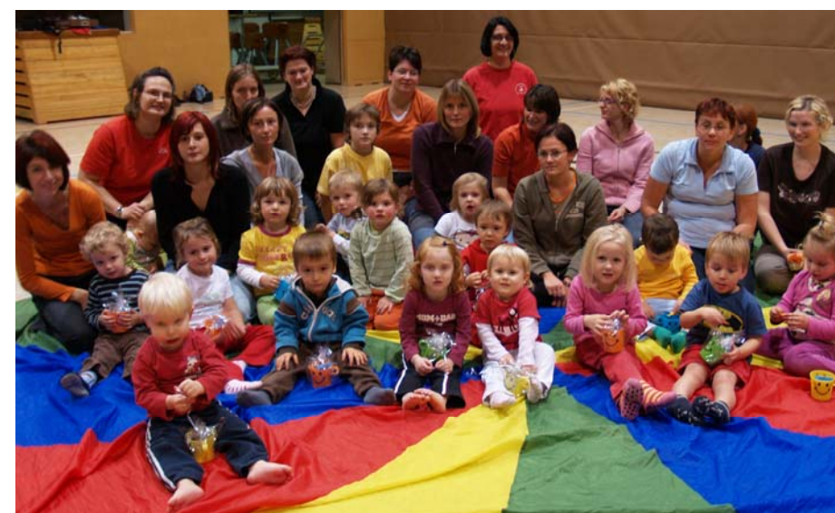
Mutter-Kind-Turnen: der nächste MUKI- Kurs findet statt im Frühjahr 2008!