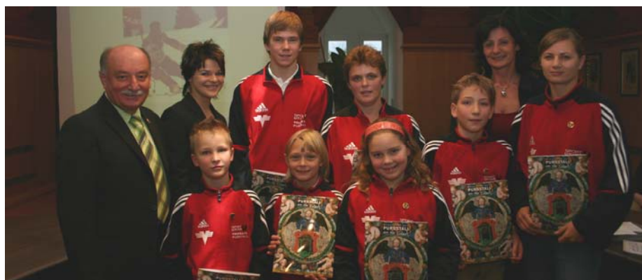
Sportunion Volksbank Purgstall - Schilaulauf