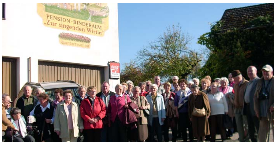
Die PVO-Reisegruppe auf der Binderalm.